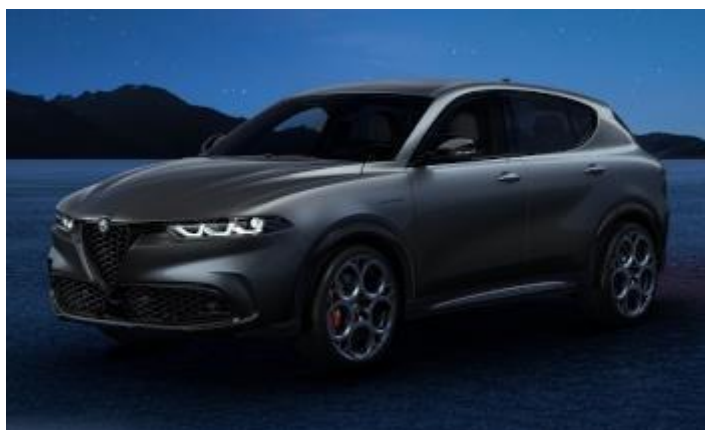
3XV (581) - Grigio Vesuvio