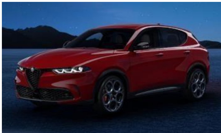
1WY (414/C) - Rosso Alfa