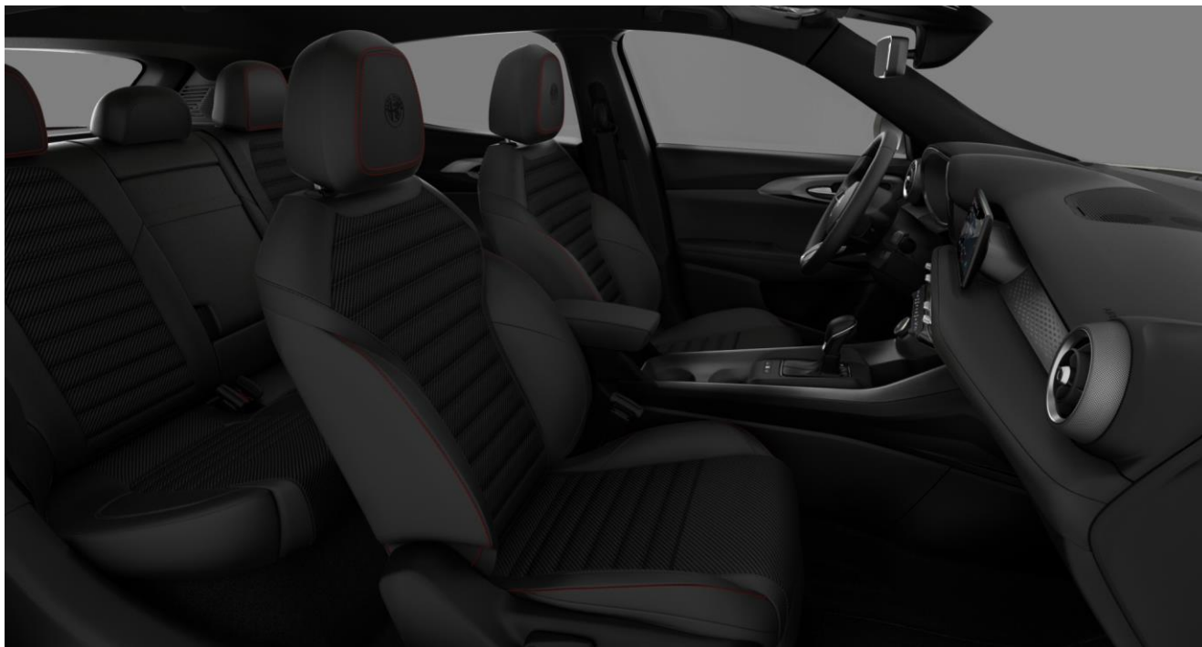
051 – Stofa neagra Soft-Touch (standard Sprint)