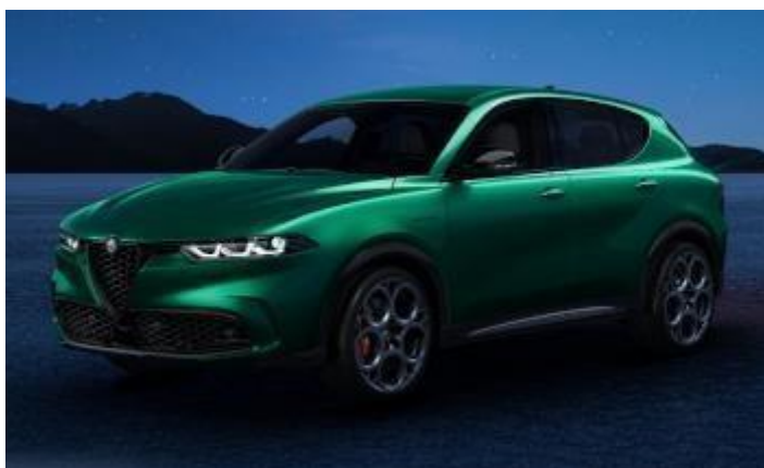
6FW (398/D) - Verde Montreal