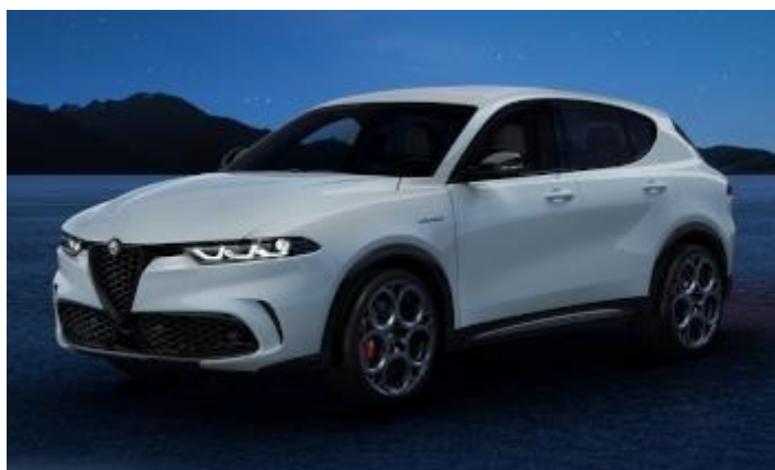
1WX (217/B) - Bianco Alfa