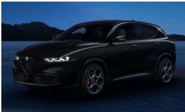
6FX (601) - Nero Alfa