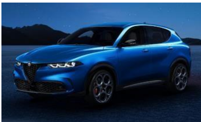
3YS (756/A) - Blu Misano